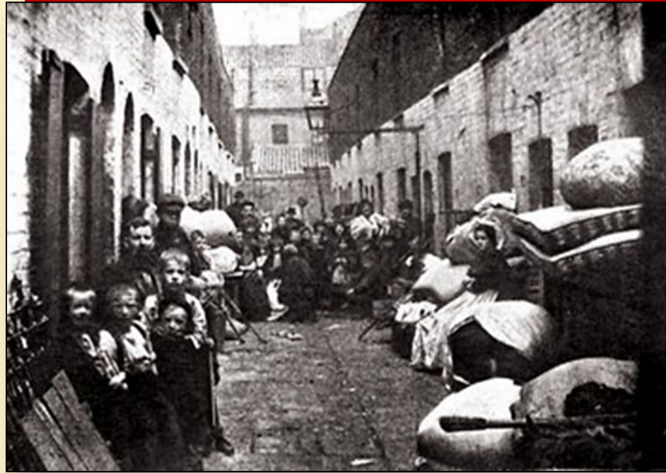
Famílias operárias amontoadas em uma rua de um bairro pobre de Londres, 1860

Viviam em cubículos, sujos e mal arejados, localizados em ruas estreitas sem iluminação e mal cheirosas