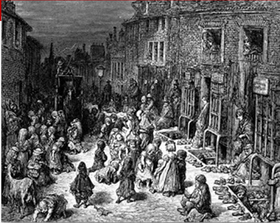
Rua de um bairro operário de Londres, 1844

Como nem todos conseguiram trabalho, se formou uma massa de desempregados miseráveis, vivendo diretamente nas ruas e nos abrigos para indigentes.